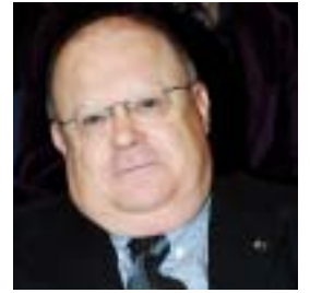
On. Giuliano Cazzola, vice presidente Commissione lavoro pubblico e privato-Camera deputati