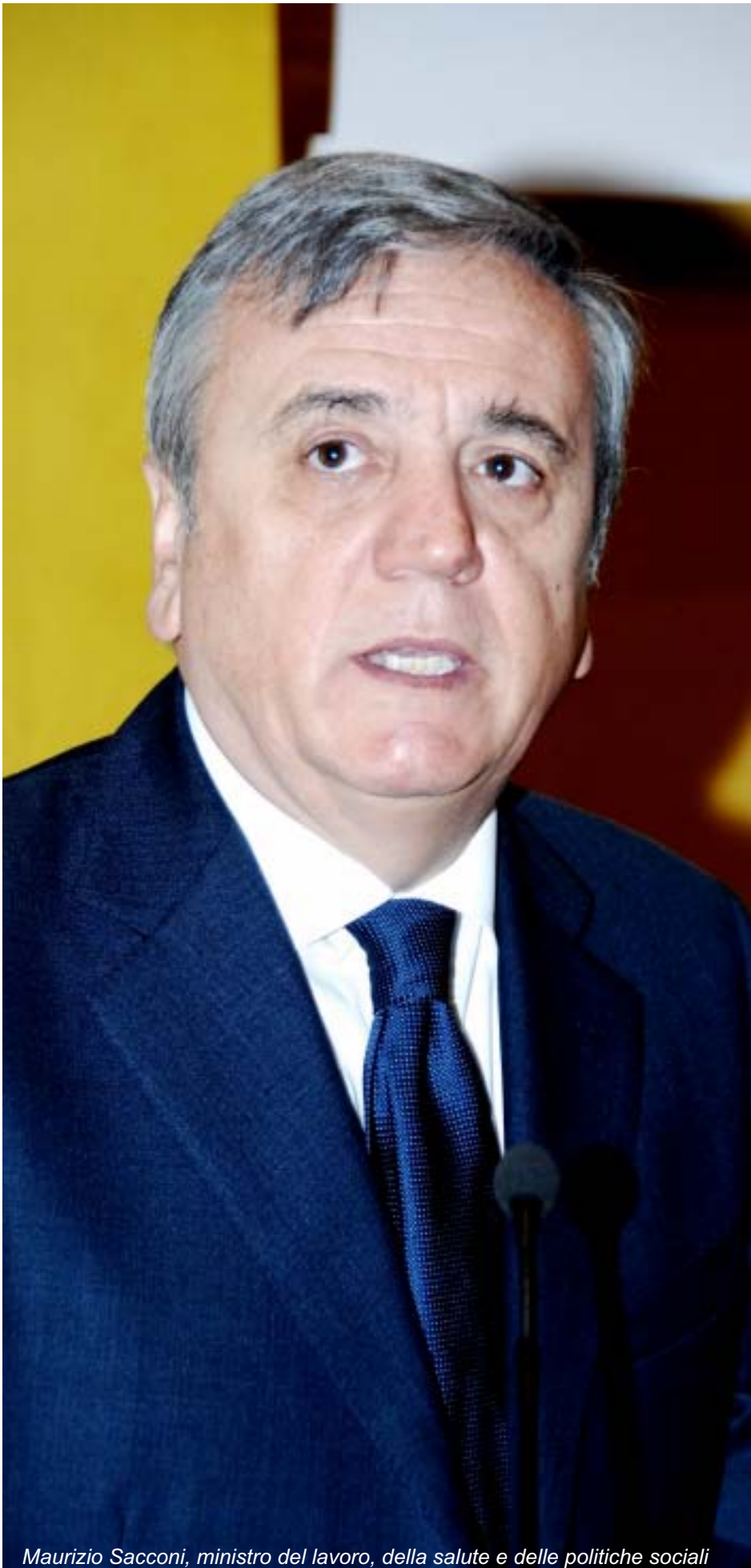
Maurizio Sacconi, ministro del lavoro, della salute e delle politiche sociali

e proficui rapporti con Crescimbeni, nei confronti del quale ha espresso profonda stima e vivo compiacimento per l'azione sin qui svolta e per quanto si andrà a realizzare al fine di migliorare l'andamento e la gestione della spesa previdenziale nel campo del pubblico impiego.